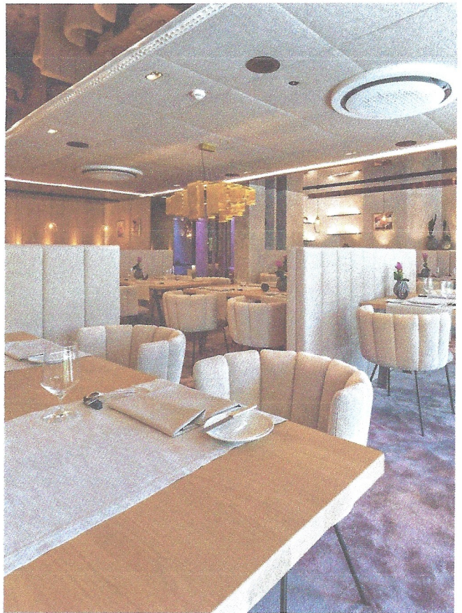
Gourmet Restaurant Schlossberg neu gestaltet

Die Wellnesslandschaft bekam Zuwachs ganz oben: Per Fahrstuhl geht es direkt auf eine 800 Quadratmeter große Dachterrasse mit Burgfels-Sauna und Panoramablick. Highlight im Wortsinne ist der Infinity-Sky-Pool: Schon während des Einbaus sorgte er für spektakuläre Bilder. Ein Spezialkran beförderte die 8000 Kilogramm Leer- und Schwergewicht an Ort und Stelle.